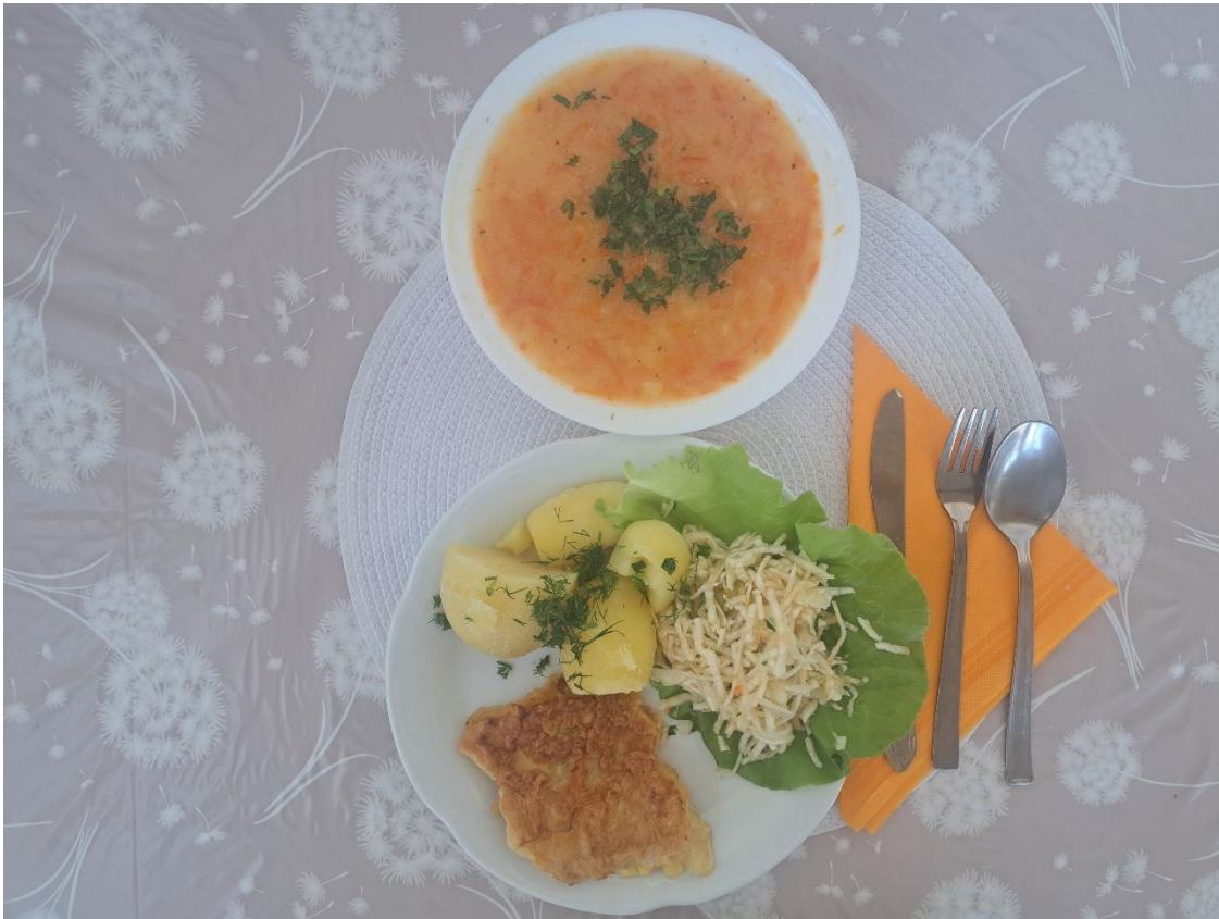
Dieta lekkostrawna i wątrobowa